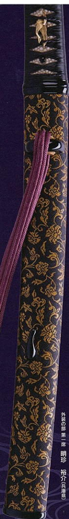
外表の部 無堂 明珍 裕介兵衛忠