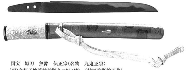
国宝 短刀 無銘 伝正宗(名物 九鬼正宗) (附)金梨子地葵紋散鞘合口短刀拵 (林原美術館所蔵)

この度は、全国の刀匠・刀職者から、外装付短刀等の作品を募り、優秀な作品を選出し、総出品数44件(総合の部7、刀身の部30、外装の部7)を展覧いたします。同時に林原美術館所蔵の御刀(国宝3口、重要文化財9口)、人間国宝の御刀1口、縁起の良い刀装具8点、池田家伝来の刀掛1基を展覧いたします。現代まで引き継がれてきた日本刀の伝統美をご堪能いただければ幸いです。