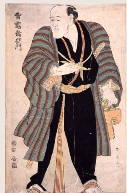
雷電為右衛門

開館時間 / 午前9時30分~午後5時(会期中の金曜日は午後8時まで) ※入館は閉館30分前まで 観覧料 / 【特別展のみ】大人1,000(900)円 高校生・大学生700(630)円